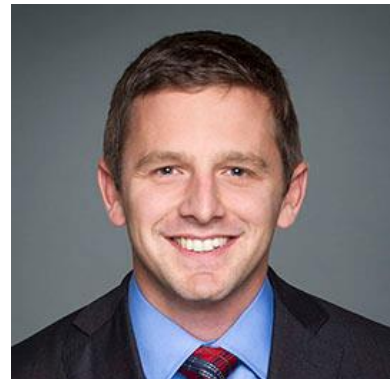
Francis Drouin Co-président d'honneur Député provincial